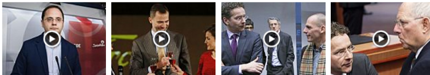
Especial Elecciones 2015: Gabilondo toma ventaja en las... Freixenet finaliza por todo lo alto la fiesta de su... Grecia acepta la prórroga pero Berlín mantiene sus... El Eurogrupo da 72 horas a Grecia para que acepte el rescate