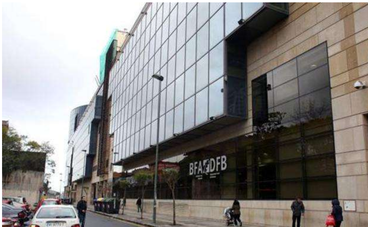
Fachada del edificio de la Hacienda de Bizkaia.

El colectivo sostiene que la Diputación «improvisa sobre la marcha» y no descarta pedir que se prorrogue un mes más el plazo de declaración